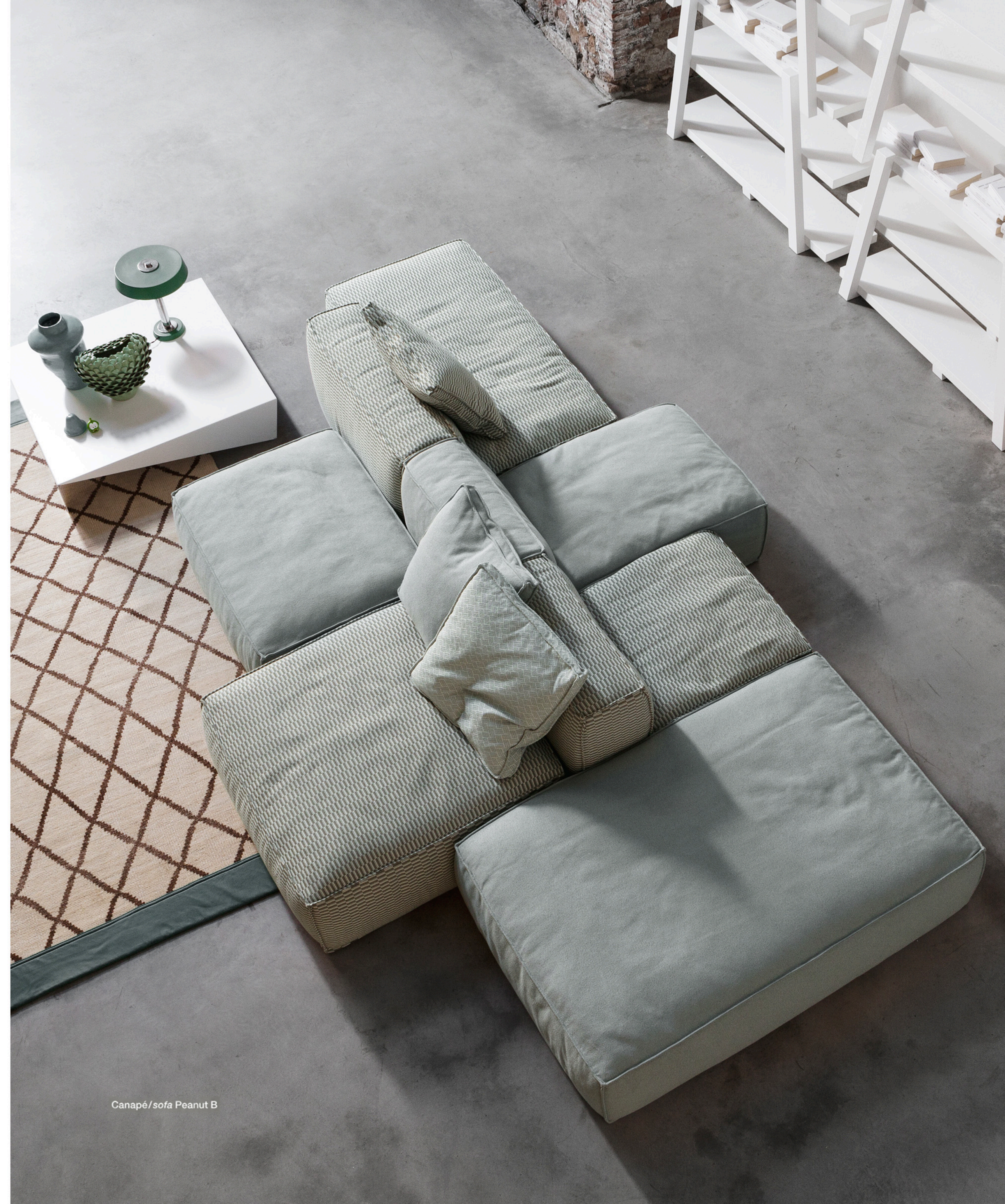
Canapé/sofa Peanut B