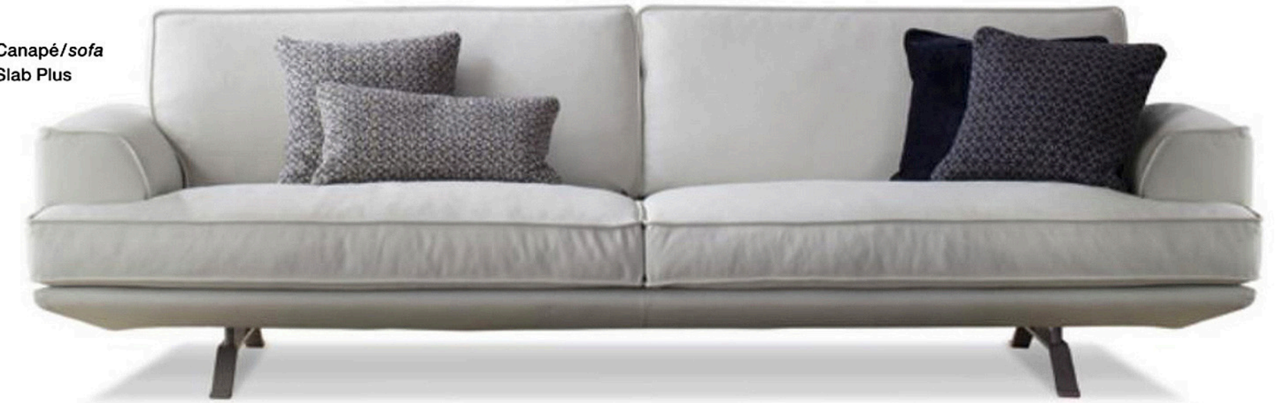
Canapé/sofa Slab Plus